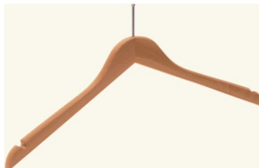
321H S+Z - cena 8,35 zł netto/szt. dł. 440 mm, grubość 13 mm