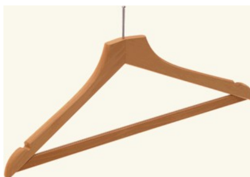
OKRNH S+Z - cena 8,60 zł netto/szt. dł. 445 mm, grubość 14 mm