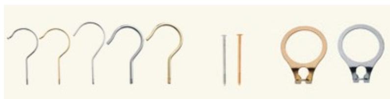
haki, sztyfty i zaczepy hotelowe